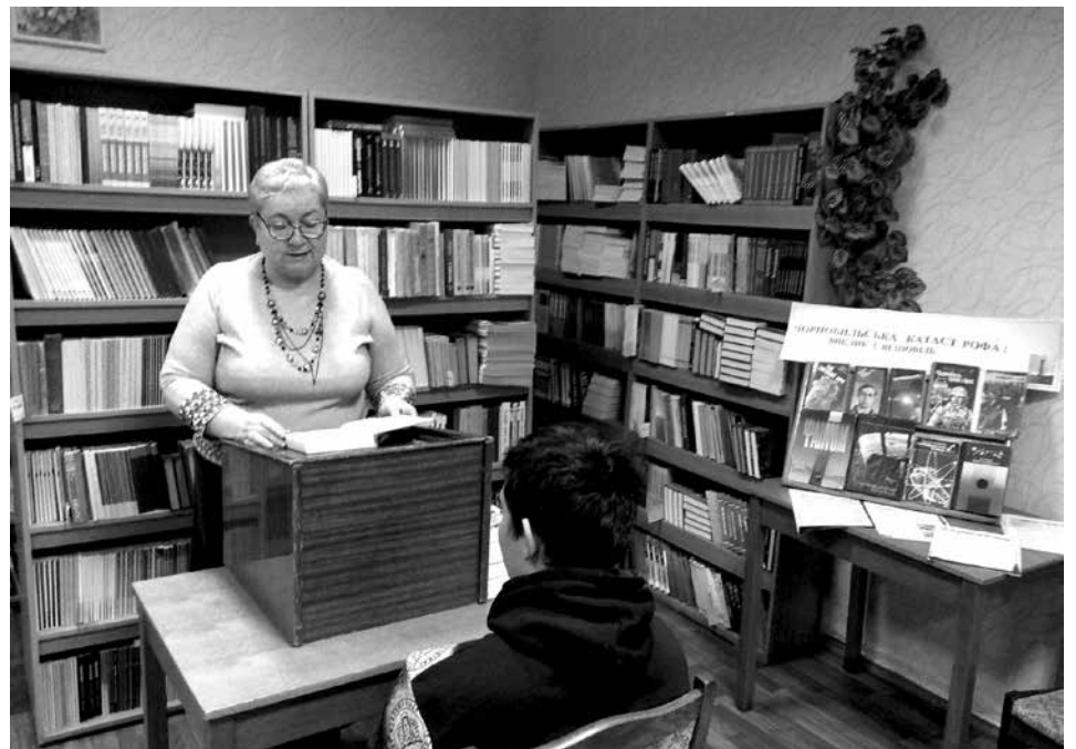
Світлина з виховної години «Дзвони Чорнобиля», яка відбулася у читальній залі бібліотеки агроколеджу, з нагоди Дня ліквідатора.